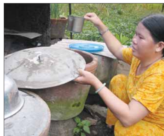
watervoorraad in potten

Knokkelkoorts of dengue fever wordt veroorzaakt door een virus dat door de mug Aedes Aegypti van mens tot mens wordt overgebracht. De symptomen variëren van een goedaardige, lichte koorts tot iets wat lijkt op een zware griepaanval met complicaties zoals gewrichtspijnen en spontane (inwendige) bloedingen. Er bestaat nog altijd geen remedie voor de ziekte, voorkomen is daarom het enige wapen in de strijd.