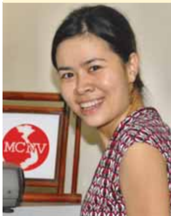
Geschreven door: Ha Viet (vertaald door Ab Stokvis)

Halverwege de berg stopt onze auto. Knipperend met de ogen in de felle zon kijken we om ons heen, Tien roept: "we zijn er!". Ze gaat voorop langs een smal pad tussen de groene cassavevelden, en even verderop doemt het huis op van mevrouw Bi Nang Thi Dieu, die hulp heeft ontvangen van het MCNV. Achter ons